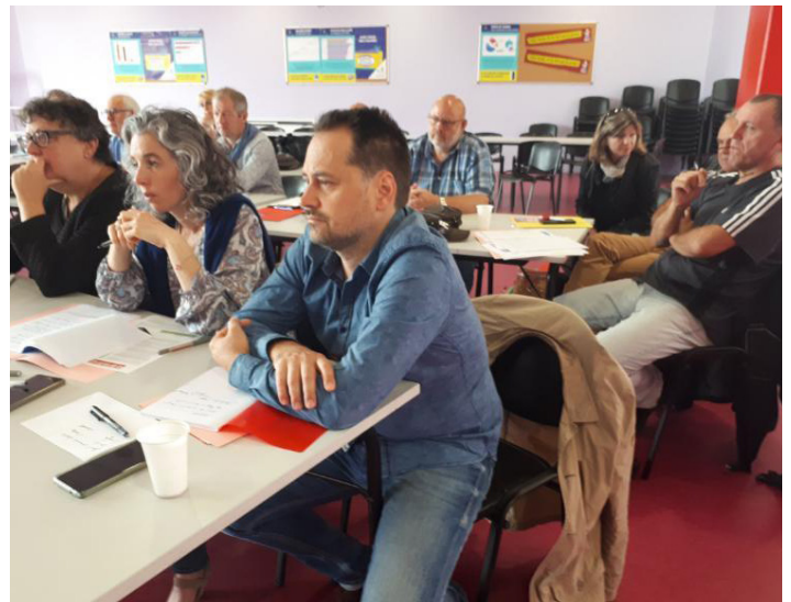
Le métier s'est complexifié et judiciarisé, une formation à la hauteur devrait être dispensée.