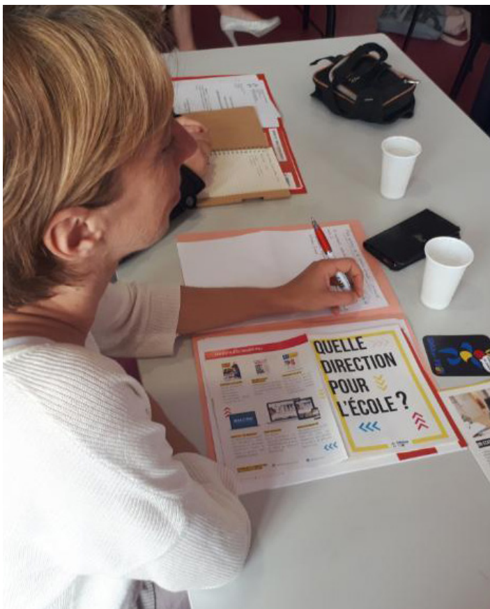
Dans les situations de conflit notamment avec des parents, la direction se sent souvent peu soutenue par sa hiérarchie.